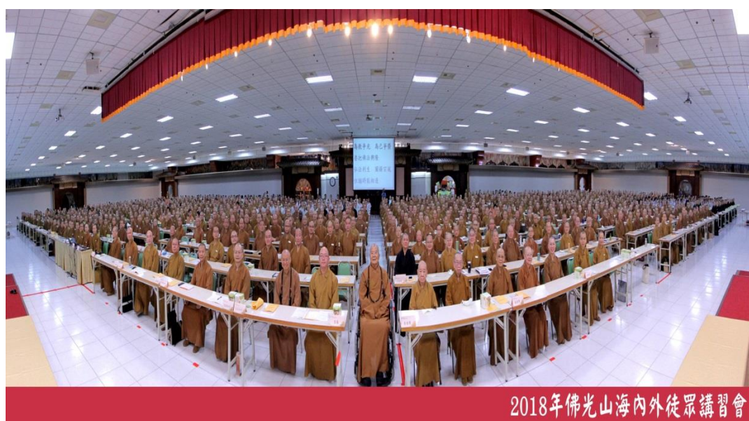
圖 9 佛光山僧團弟子與大師合影