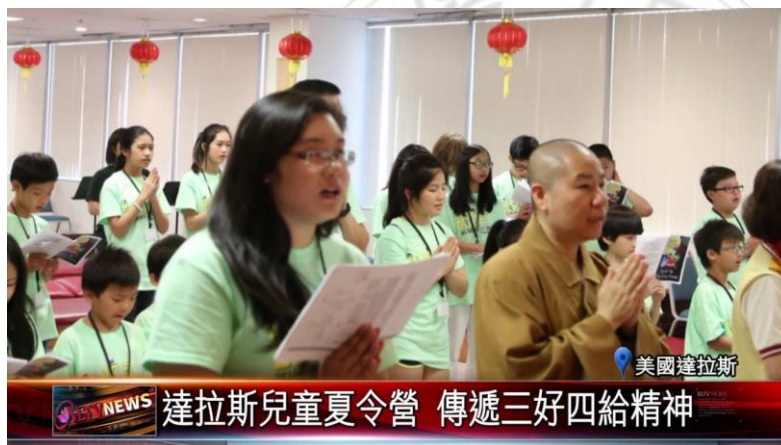
圖 6 大師三好、四給精神也傳播到美國達拉斯

四給精神源於原始佛教教義，繼承大乘佛教的精髓。大乘佛教就是要使一切眾生離苦得樂，因此要深入世界，在人間幫助眾生。釋迦牟尼佛就是人間的佛陀——出生在人間，修行在人間，成道在人間，度化眾生在人間，一切都在人間完成。大師認為：「佛陀展現的就是人間佛教，具有六個特徵：人間性、生活性、利他性、喜樂性、時代性和普濟性。而今天的人間佛教建設，就是要把原始的佛陀時代的教法與現代化的佛教融合起來，統攝起來。」 89 這六個特徵都是要因時、因地、因人而施用，所以「給」是要有智慧的「給」。如慧傳師說：「到美國發展時，不要只按照自己的想法去做事，一定要聽聽當地人怎麼想，因為他們害怕你來會造成什麼問題，所以你就公開，讓他看，讓他能夠信位。而且一定要給，但不要用自己的想法給，要依照他們的自己的想法給。我覺得大師的這一個給，是有同理心的，不是說我高高在上的給，是給你的時候還要尊重你，還要體諒你的想法，讓你有尊嚴，這種『給』，人家就會接受。」 90 因此追溯大師的四給的做法，即是出於對現代人的體貼而來實行，把人間性、生活性、利他性、喜樂性、時代性和普濟性統統兼顧到，正大師的智慧與慈心悲願。