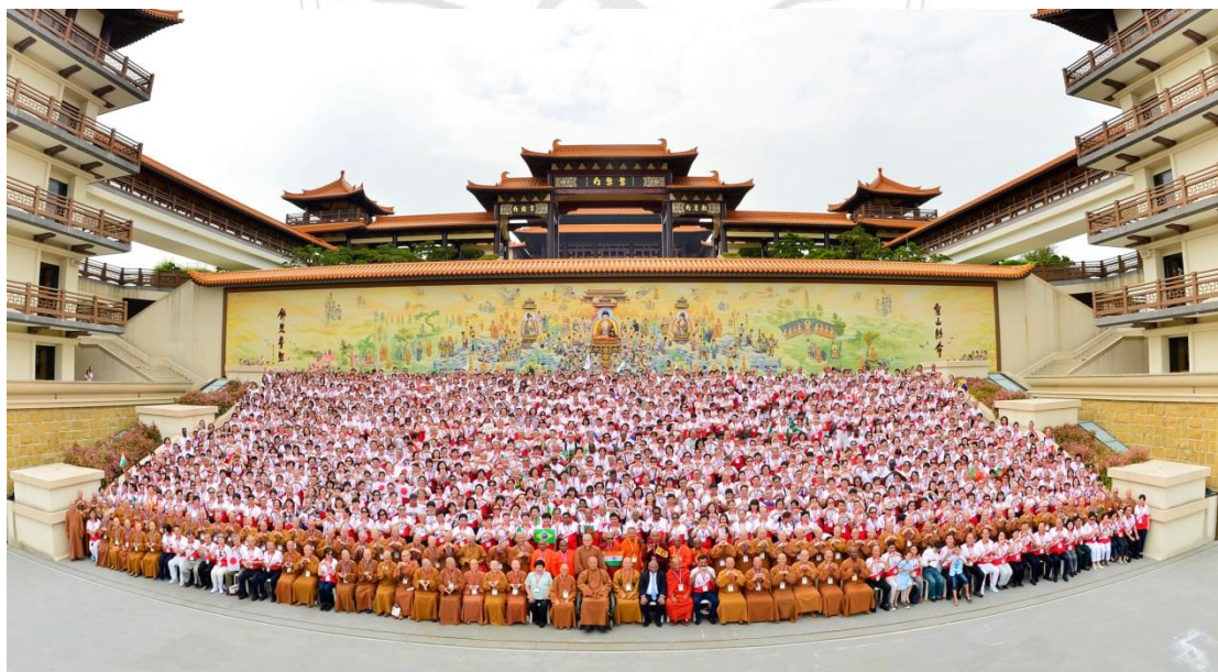
圖 13: 國際佛光會世界會員大會 於佛光山藏經樓 2018.10.10

四給是學人本來應該具備的條件，一個人寧可什麼都沒有，但是不能沒有慈悲。慈悲即四給，這不是用來衡量別人的尺度，而是自己身體力行的給予；慈悲不是用來沽名釣譽的工具手段，而是真愛實踐的流露。慈悲不應該有省籍的界線與地域的分別，應該是一種不以己悲，不以物喜，能以天下之憂為憂，以天下之樂為樂的胸懷。多年來的處世經驗，使大師深深感到：唯有慈悲，才能化干戈為玉帛，消怨對於無形；唯有慈悲，才能廣結善緣，成就事業。修行最重要的是修心，大師希望每個佛光會員心裡都充滿了慈心、悲心、喜心、捨心等「四給之心」。然後進一步把慈悲喜捨的四無量心遍給於法界之中，讓世界到處充滿祥和，讓佛光普照人間。