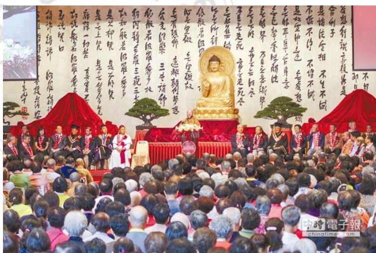
圖 3 星雲大師為慈悲做出開示

慈悲之心是萬物所以生生不息的泉源，人間所以使人們戀棧，是因為人間有慈悲。一個家庭如果沒有慈悲，縱然再舒適也形同冰窖；一個服務機關如果沒有慈悲，即使待遇再優厚，也難留住人心。親人之間沒有慈悲的心，形同陌路，