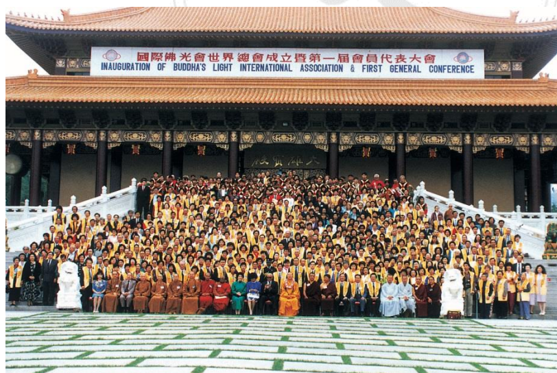
圖 16 國際佛光總會第一屆大會-星雲大師與其他會員大合照

六、南北教團互相融和：佛教發源於印度，佛滅後分為南、北兩派向外發展，自此南、北傳佛教縱有人交流，然因承襲的教義及戒律的差異而各弘其道。自國際佛光會成立以來，每年與各地佛光會道場合辦的供僧法會，均邀請南、北傳法師一起應供，增進彼此之間的交流融和，而與「國際佛教促進會」聯合主辦的「國際佛教僧伽會議」，讓南北傳的比丘、比丘尼共聚一堂，討論佛教未來的問題，促進了南北教團的共識與融和。一九九八年二月，佛光會即將在印度菩提伽耶傳