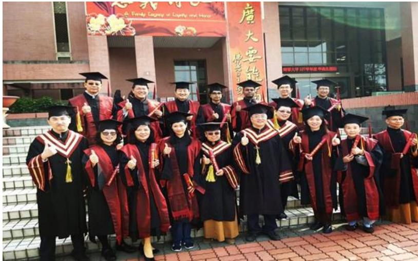
圖 10:南華大學 106 年級宗教所畢業生合影

今時世界已邁入現代化、科技化，但不容否定的是傳世的言論與思想，仍具有興邦喪國的影響力。因此教育是人類傳遞和開展文明的方法，大師對教育的重視由此可見。大師語重心長指出：「過去有些寺院寧可用二噸重的黃金塑造佛像，卻不懂得推動佛教的文教事業，失去了佛教存在的意義與本質。所以，未來人間佛教的發展，不要只看到黃金，看不到智慧；所謂『法身慧命』，沒有智慧，就沒有生命。」 152 因此，在大師看來未來的教育將會是一種「萬有的教育」，必須學習體會世界上的一切，以隨時向眾生說法。大師雖總謙稱沒接受過社會教育，其實對於教育模式瞭若指掌：「在我個人的人生字典裡，教育分有好多種類。所謂佛教教育，有僧伽教育、居士教育、兒童教育、慈善教育；在社會教育裡，如一般的學校教育、職業教育、婦女家事教育，以及各種職業訓練班等。」 153 對於教育的核心，大師化繁為簡，一般人以為教育就是學多少字、讀多少書、知道多少常識。從上可知大師認為：教育最重要的是正確的價值觀與生活態度。