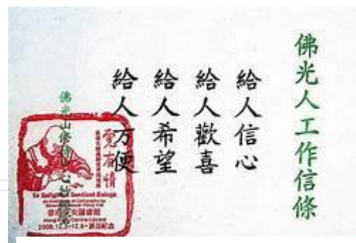
圖 2 佛光人的工作信條—四給

大師的要人廣行菩薩道，以使佛教走向現代化，為一般眾生所接受，故要積極走出去，觀懷眾生。佛教的真理是永恆不變的，但是佛教的發展，不能一味的保守傳統。傳教的方式必須隨著時代發展而有所改變，必須傳統與現代融和，僧眾與信眾共有，修持與慧解並重，佛教與藝文合一。這是我們未來推展人間佛教的方向，也是佛教發展的時代趨勢。如大師說：「與其強調身口意，不如我們來奉行『三好』：身做好事，口說好話，心存好念，自然不會造作惡業；沒有惡業，也就沒有所謂的貪瞋痴。」 49 大師提倡以「三好」轉「三業」，並不是創新而是復古，把過去諸佛菩薩的教化，以現代人熟悉，樂意接受的方式，積極主動的推