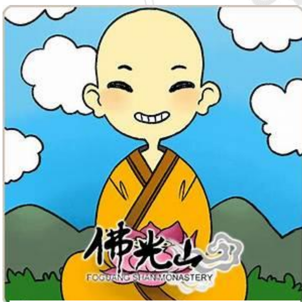
圖 4、佛光山歡喜卡通圖

一個國家唯有經濟繁榮，才能建設「富而好禮」的社會。然而大師眼看著當代的社會，舉世人類由於過度追求物質享受，反而人為物役，無法得到物質生活帶來的快樂。例如現在全世界都流行使用「信用卡」，購物時商家也喜歡提供民眾「分期付款」，結果大家累積了各種卡債，為了分期付款忙忙碌碌的生活，出現了卡債一族，這那有快樂可言？現在的家庭，為了衣食住行，每日在柴米油鹽中汲汲營求，可以說不是忙得不亦樂乎，而是忙得自己都不認識自己了。因此，人類要想求得一份快樂，必須從物質的束縛中解脫出來，因為世間的物質有限，而人的欲望無窮。因此我們不能只是追求感官上的欲樂，要從淡泊物欲中體會精神心靈上的安然自在；要從慈悲喜捨的修行上，感受禪悅法喜。甚至不但追求個人的心靈富樂，還要懷抱先天下之憂而憂，後天下之樂而樂的胸懷，為舉世人類創造和平安樂的生活。