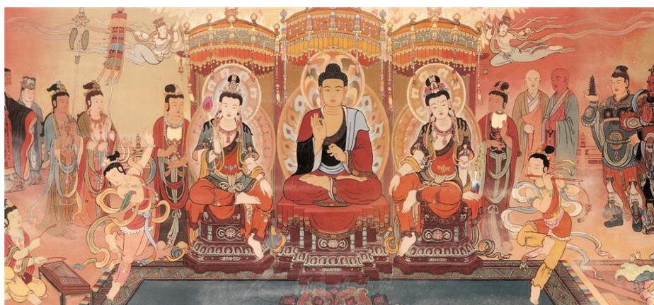
圖 7 共創人間淨土

大師倡導「人間佛教」，以佛光山本山與各處別分院作為基地，在海峽兩岸及世界各地推動佛法的生活實踐，蔚為一股不斷茁壯繁興的當代佛