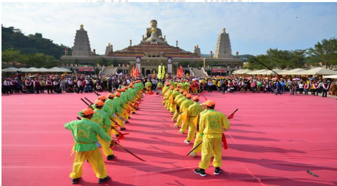
圖 12 佛陀紀念館與神明聯誼會體現著從佛教到他教的融合精神