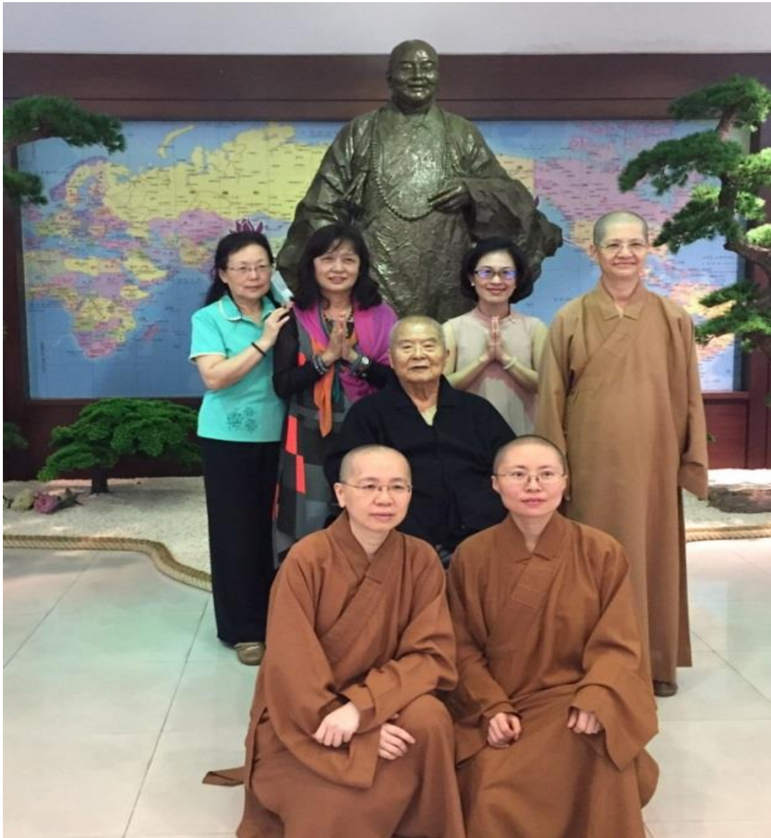
圖 18 2019 年春，筆者回山，巧遇大師

「給」是星雲大師的「初心」與「一生實踐」。子曰：「人能弘道，非道因弘人。」佛教應該要弘揚教義，要以佛法來淨化人心，這才是佛教的根本，此佛教需要說法，需要傳教，需要教育。人才是教育的目標，而教育是人才的搖籃。大師以「四給」來開發慈悲喜捨，落實在人間，與二千六百年前佛陀的精神，相得益彰！人根本的做法就是「給」。大師「給」的哲學就是與人為善，廣結善緣。