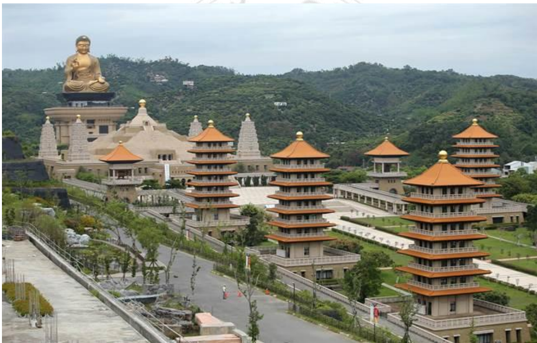
圖 5 佛光佛陀紀念館每年為眾神明提供聯誼活動

在世間上做人，有各等的層次，就以生活來說，也有不同的層級。想生活最高的境界，就是物質的生活要淡泊、精神的生活要昇華、藝術的生活要豐富、慈悲喜捨的生活要提升。當人能從世俗的物欲中超脫出來，能在慈悲喜捨裏找到安身立命之處，從而獲得平安祥和的禪悅法喜，自然人人自心和悅，推及開來，必然家庭和順、人我和敬、社會和諧、世界和平。如佛陀說：「在今日人間佛教的理想世界裡，大家同為地球人，彼此應該不分種族，共同為人類幸福而努力。所以，未來在佛光普照下，人間淨土的第一個特色，就是沒有種族歧視，沒有階級鬥爭，真正徹底實現「眾生平等」的真理。」 88 大師教人開發人內心的寶藏，會越捨就越多，因為人在世的福來自於捨的行為，越捨越富足，故才能源源不絕。與世間結緣創造更多的能量，人要與人共創限好的世間，具和諧的信念才能創造禪悅的人世。「四給」的是人間社會所追求的這種理想境界，人人都能捨得，才能創造財富；有了財富，還要去促進社會的和諧。就更更要慈悲喜捨，更要去做「四給」，大師認為這就是「四無量心」的信仰，這確實是建設富而好禮的人間社會的不二法門。