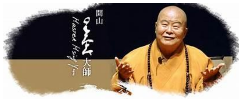
圖 14 大師的開示表情生動

以「四給」來開發「慈悲喜捨」，更是其根本的做法就是「給」，這也正是大師的心法所在。大師「給」的哲學，就是與人為善，廣結善緣，這已經成為大師自然的行為，如慈惠法師所說：「如果以修行來講，