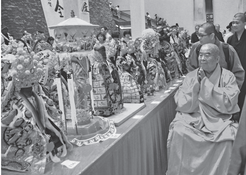
星雲大師向參加神明聯誼會的各路神明致意

誼會能再延長為三天到五天，透過週邊舉辦文化、藝術、宗教、陣頭等主題的宗教對話論壇，再逐步深化理解，不但促進信徒間的交流，亦為文化傳承創新。