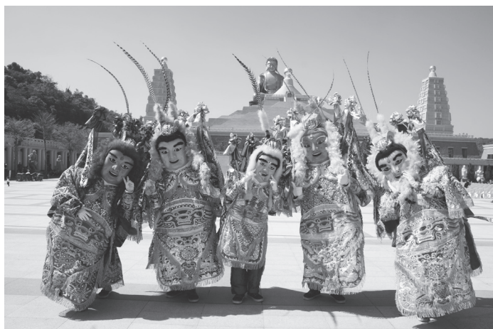
參加神明聯誼會的五尊電音三太子

返鄉遊子向王爺祈福，「未來一整年都能行車平安、家庭美滿」 94 。近年更發展出結合電子音樂、佩戴眼鏡、手拿螢光棒等造型的電音三太子。國家地理頻道也曾在 2012 年由黃建亮導演製播《愛上真台灣：電音三太子》。