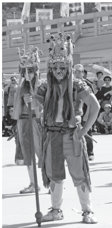
台中拱生堂官將首呈現特色陣頭文化，成員從二十至三十多歲不等，大都從國中開始練習。