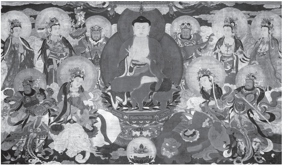
華嚴三聖與四大天王

自他幼時恭敬「仙女娘娘神像」 30 、「給觀音老母做義子」 31 、「禮拜至聖先師孔子」 32 ，出家後「儒道經典學習」 33 ，及弘法過程中友廟提供場所布道，並在其中認識道人以及巧遇信眾進香經驗「持香默禱……跪伏在地上，等待著『鑽轎腳』儀式」 34 ，感受到媽祖的威德力。後來佛光山全台灣舉辦行腳托鉢，「神道教的宮廟觀堂」 35 對佛祖、僧寶的尊敬，「樂於捐獻」 36 建寺院，甚至佛陀紀念館落成，「關聖帝君、天上聖母、福德正神、濟公禪師、五路財神、三太子、七爺八爺、溫府千歲、千里眼、順風耳等各路神明」 37 ，共襄盛舉與佛陀結緣，上述與民間信仰不孰悉但又親切的宗教旅程經驗，促成他關懷提升民間信仰的層次，並指出「佛教、道教若能提升教育水準，訂定組織規章，神棍也就無法立足寺廟」 38 。上述總總，可